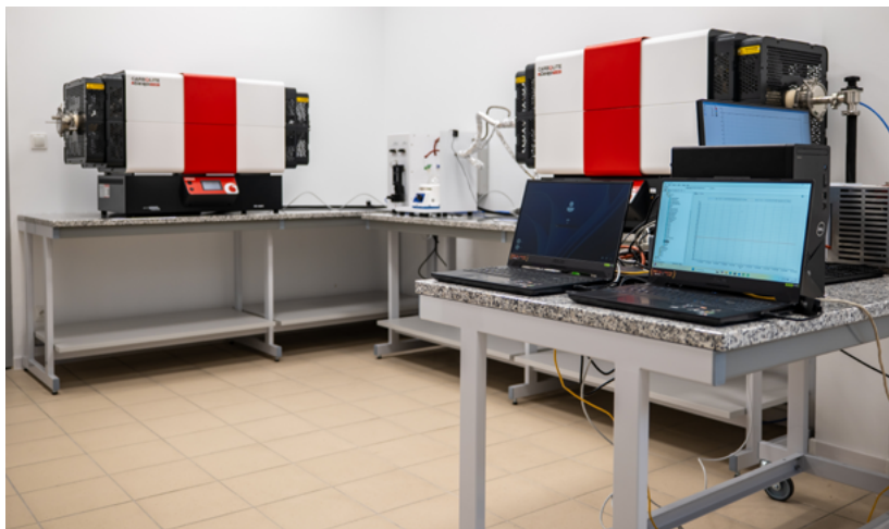
Rys. 2. Laboratorium wysokotemperaturowego utleniania w parze wodnej

przesyłowego 13 . Tego typu badania są kluczowe dla oceny trwałości materiałów w trudnych warunkach przemysłowych i umożliwiają wdrażanie bezpiecznych i trwałych rozwiązań stalowych w infrastrukturze wodorowej oraz innych aplikacjach przemysłowych.