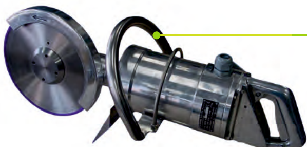
Przecinarka tarczowa rozbiorowa PTRc 250H III

Zastosowanie: rozbiór półtuszy i ćwierćtuszy wieprzowych, wołowych, końskich, baranich w zakładach mięsnych dowolnej wielkości.