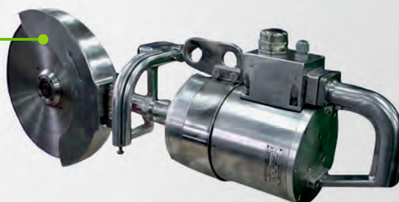
Przecinarka do rozcinania mostków PRUb 135 III

Zastosowanie: rozcina tusze wieprzowych, baranich, cielęcych, kozich, a także dziczyzny w zakładach mięsnych dowolnej wielkości.