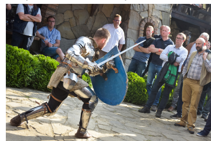
Pokazy rycerskie w trakcie wycieczki na zamek do Grybowa

Goście tegorocznej Konferencji uczestniczyli w wycieczce do Zamku "Stara Baśń" w Grybowie, gdzie poza zwiedzaniem wzięli udział w licznych konkursach i pokazach.