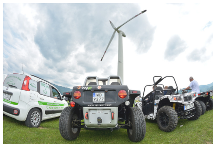
Kordon pojazdów elektrycznych "wspiał" się aż pod samą elektrownię wiatrową

Wzorem lat ubiegłych odrębną sesją była sesja dotycząca Elektromobilności , na której prym wiodły zagadnienia związane z projektowaniem, eksploatacją pojazdów i środków transportu o napędzie elektrycznym. Konferencji towarzyszyła wystawa pojazdów elektrycznych, gdzie goście mieli możliwość osobiście zasiąść za ich kierownicą, a śmiałkowicie na rowerach elektrycznych zajechali aż do Piwnicznej. Wystawę uwieńczyła parada pojazdów elektrycznych, które z ogromnym wdziękiem prezentowały swoje walory pokonując trasę spod hotelu aż pod elektrownię wiatrową.