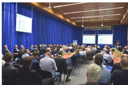
Obrady plenarne zgromadziły liczne grono słuchaczy

W dniach 23-25.05.2018 r. w Ryttrze po raz 27. spotkali się uczestnicy Konferencji Naukowo-Technicznej „Problemy Eksploatacji Maszyn i Napędów Elektrycznych”, organizowanej przez Instytut Napędów i Maszyn Elektrycznych KOMEL z Katowic przy współdziałaniu firmy WEG International Trade GmbH. Tegoroczna Konferencja PEMINE zo-stała po raz pierwszy objęta honorowym patronatem przez Ministra Przedsiębiorczości i Technologii - Panią Jadwigę Emilewicz . Patronat nad Konferencją po raz kolejny objął Komitet Elektrotechniki PAN. Konferencję zorganizowano przy współpracy Stowarzyszenia Elektryków Polskich.