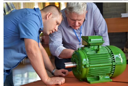
Stoiska firmowe, w tym stoisko reklamowe firmy WEG International Trade GmbH (poniżej)

Na stoisku KOMEL zaprezentowano pierwszy polski napęd elektryczny do autobusu miejskiego oraz informacje dot. oferowanych usług, m. in. w zakresie: elektromobilności, cięcia laserem, hydrogeneratorów oraz zespołów elektromaszynowych. W ramach paneli informacyjno-promocyjnych zorganizowano dwie sesje prezentujące projekty: "Nowa generacja wysokosprawnych elek-